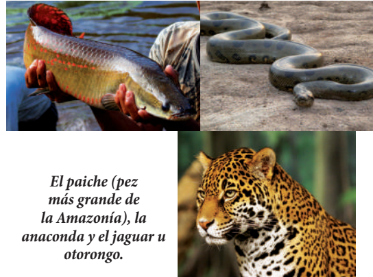
El paiche (pez más grande de la Amazonía), la anaconda y el jaguar u otorongo.

Al igual que la flora, también es abundante, por ello entre los peces destacan: paiche, gamitada, zábalo, zúngaro, boquichico, carachama; en reptiles, la anaconda, motelo, charapa, caimán negro; en mamíferos: el otorongo, sajino, ronsoco, oso hormiguero, oso perezoso, y en aves: tucán, guacamayos, shanshos, etc.