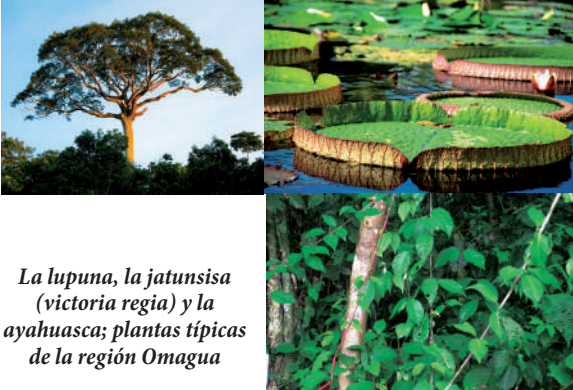
La lupuna, la jatusisa (victoria regia) y la ayahuasca; plantas típicas de la región Omagua

Es la región con la mayor biodiversidad, por ello mencionaremos las más significativas: entre los árboles madereros, tenemos a la lupuna, el cedro, la caoba, el tornillo, etc.; palmeras como la chonta, el aguaje y otras especies como la ayahuasca, la jatunsisa (más conocida como victoria regia), etc.