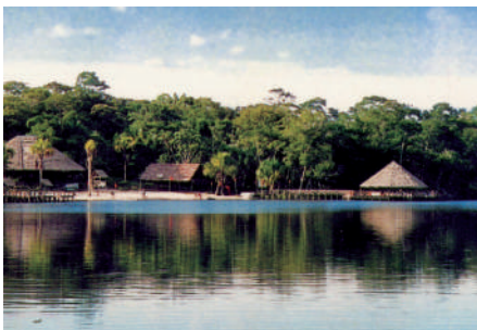
La ciudad de Iquitos ubicada a 106 msnm está ubicada en la región Omagua.