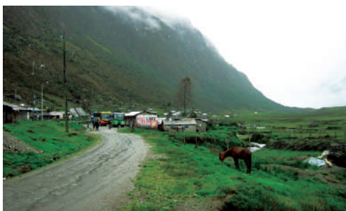
En imágenes, la ciudad de Satipo, ubicada a 632 msnm