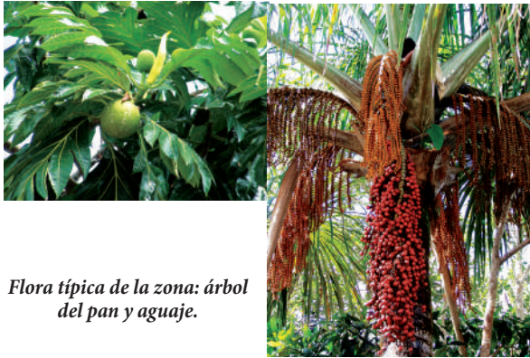
Flora típica de la zona: árbol del pan y aguaje.

La vegetación es diversa, incluye numerosas especies arbóreas, barbasco, caucho, árbol del pan, bombonaje, tamushi; también tenemos el palo de balsa, cacao de monte, toroyurco. Palmeras tales como yarina, aguaje, tahua, etc.