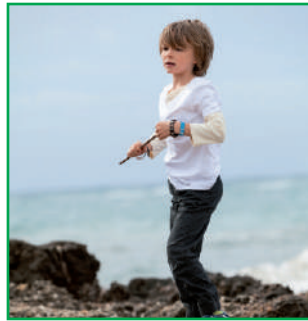
Este niño menos alto que aquel.