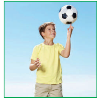
Este niño es altísimo.

Ahora puedes decirme cuál es la diferencia del adjetivo que aparece en cada oración. ¿Indican lo mismo? Claro, podemos notar que el adjetivo no presenta el mismo grado.