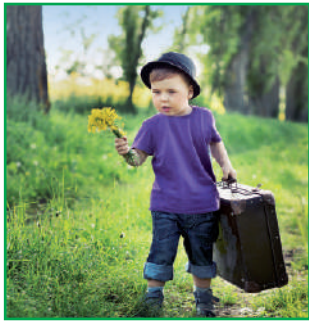
Este niño es alto.

Amiguito, presta mucha atención a las siguientes imágenes y a las oraciones que aparecen.