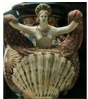
AFRODITA, diosa de la belleza

para festejar las bodas de la nereida Tetis con Peleo, Eris, la diosa de la Discordia, arrojó una manzana con la siguiente inscripción: "Para la más hermosa". Las principales diosas Hera, Afrodita y Atenea, se disputaron la primacía de belleza y eligieron como juez a