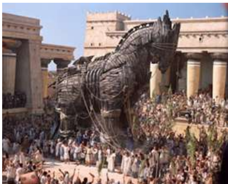
Caballo de Troya, con el que vencieron los Griegos a los troyanos.